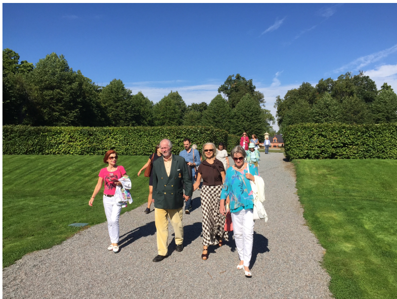
Medlemmar på besök vid Steninge Slottsby.