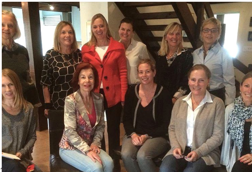
Generalsekreteraren mötte Svenska klubben i Greenwich, Connecticut, USA.

Resorna ger god publicitet och sprider kunskap om Svenskar i Världen på orter där många svenskar bor. Det är också nyttigt att på plats få information om vilka frågor som står högst på agendan för utlandssvenskarna där. De svenska utlandsmyndigheterna är viktiga samarbetspartner under dessa besök, liksom Svenskar i Världens lokala ombud.