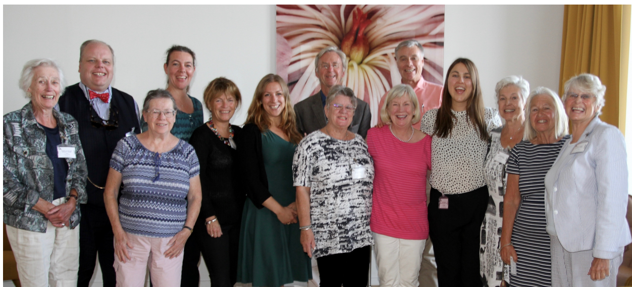
Ombudsträffen i augusti 2016 på Svenska Institutet.

engagera sig som ombud och att vi ska entusiasmera dem att vara aktiva. Vi söker även fler ungdomsombud, för att locka fler yngre medlemmar till organisationen.