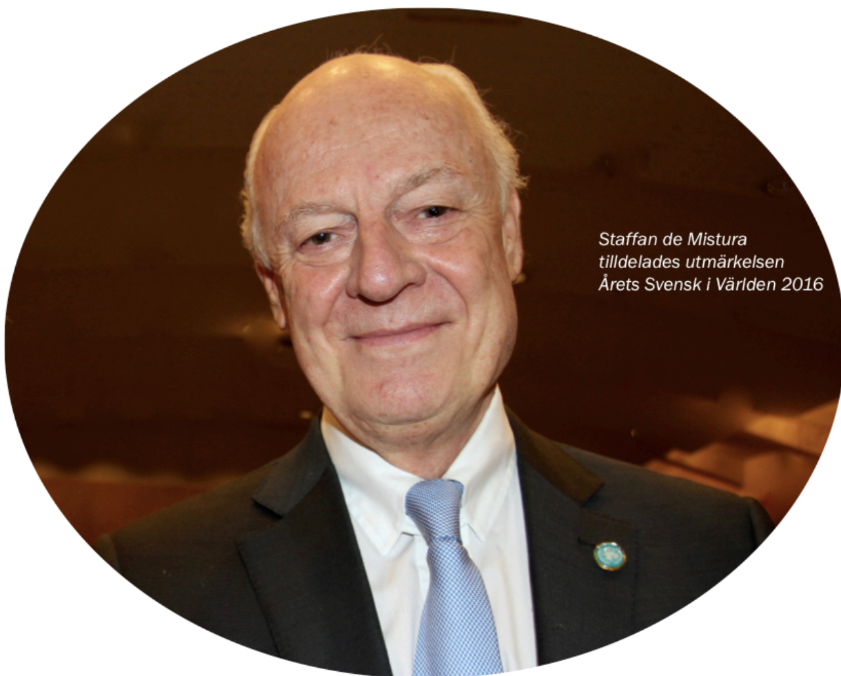
Staffan de Mistura tilldelades utmärkelsen Årets Svensk i Världen 2016